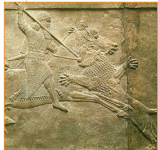
Assurbanipal II che caccia il leone, 859 a.C.