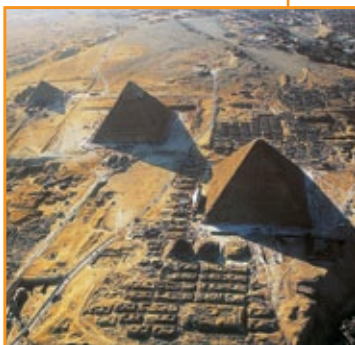
Piramidi di El-Giza , 2650 a.C.