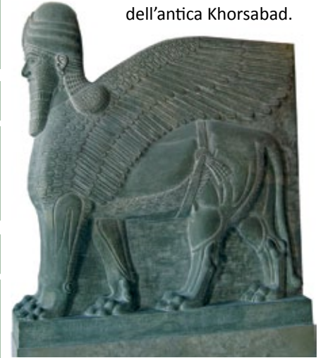
Lamassù , dell'antica Khorsabad.

I rilievi raccontano in modo celebrativo le imprese belliche dei sovrani, ma anche scene di caccia e momenti di vita di corte. Le sculture a tutto tondo esprimono il rigore sacrale della fede.