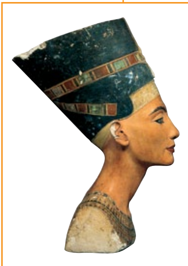
Nefertiti , 1370 a.C.