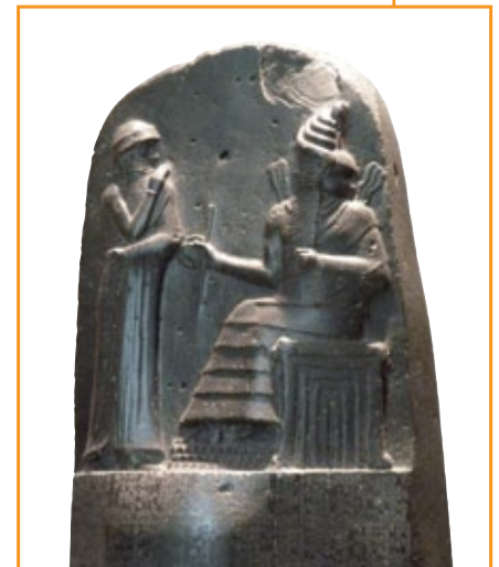
Codice di Hammurabi , 1792-1750 a.C.