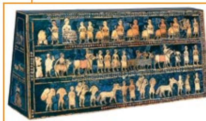
Stendardo di Ur , 2500 a.C. circa.