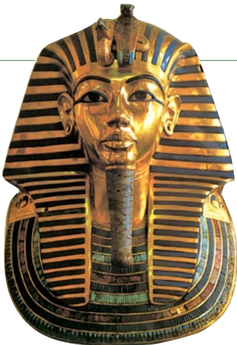
Maschera funeraria del faraone Tutankhamon, 1336-1327 a.C. Oro, ossidiana, pietre preziose, pasta vitrea, cm 54x39,3. Il Cairo, Museo Egizio.

La produzione minore rappresenta immagini di vita quotidiana con spontaneo realismo.