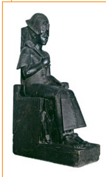
Il faraone Ramesse II , 1270 a.C.