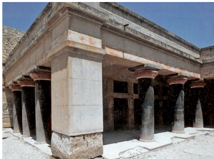
Un angolo del Palazzo di Cnosso a Creta (XVII sec. a.C.).

L'ingresso è sormontato da una possente pietra rettangolare, l' architrave ; sopra, uno spazio vuoto triangolare scarica il peso della copertura sui pedritti .