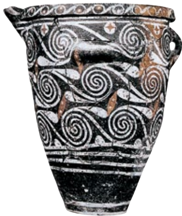
Brocca in stile di Kamàres, 1800 a.C.