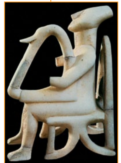
Arpista, 2300-2100 a.C.