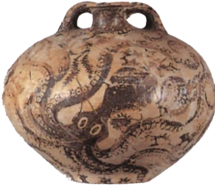
Brocchetta di Gurnià, 1450 a.C. circa. Ceramica dipinta. Heràklion, Museo Archeologico.

Ampia diffusione della pittura murale. Uso della ceramica dipinta.