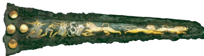
Lama di pugnale, 1600-1500 a.C.