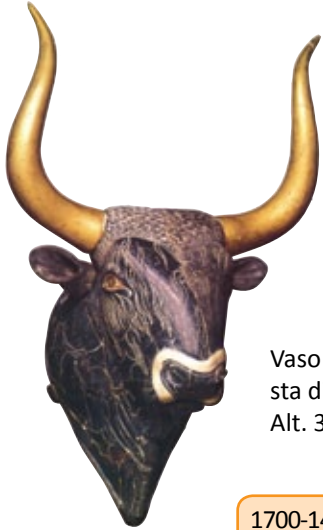
Vaso rituale a forma di testa di toro, 1450-1400 a.C. Alt. 35,6 cm.

Le sculture cicladiche, con le loro forme elementari, esprimono un forte senso della sintesi. Nelle maschere funerarie micenee vengono espressi, con pochi tratti decisi e severi, il senso drammatico e l'immobilità della morte.