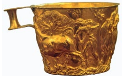
Tazza aurea di Vaphiò. 1500 a.C.