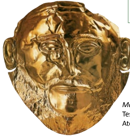
Maschera detta di Agamennone, dal Tesoro di Atreo, metà XII sec. a.C. Oro. Atene, Museo Archeologico Nazionale.

1700-1450 a.C. Ricostruzione dei palazzi cretesi distrutti da terremoti.