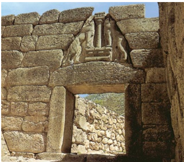
La Porta dei Leoni, eretta nel XIV secolo a.C.

I palazzi cretesi si integrano con l'ambiente naturale. Le costruzioni micenee, invece, sono imponenti e severe. Esse mettono in luce il carattere guerriero del popolo degli Achei.