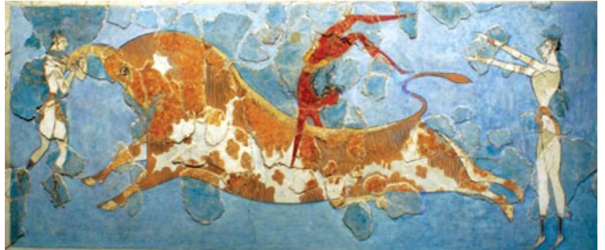
Salto sul toro ( Taurocatapsia ), 1500 a.C. circa. Affresco (in origine nel Palazzo di Cnosso), alt. 86 cm. Heràklion, Museo Archeologico.

A Creta, gli affreschi e le decorazioni nei vasi, con i soggetti rituali e tratti dalla natura, esprimono il rapporto di armonia con il mondo circostante. Sono produzioni dal gusto raffinato , espressione della ricchezza della società cretese.