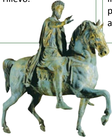
Statua equestre di Marco Aurelio, 176-180 d.C. Bronzo, in origine dorato, alt. 420 cm. Roma, Musei Capitolini.

Originale della statuaria romana è il ritratto realistico. Con Augusto e Traiano domina un'arte classicista e colta; con Marco Aurelio viene introdotta una componente espressionista. Dal III secolo l'arte assume toni simbolici.