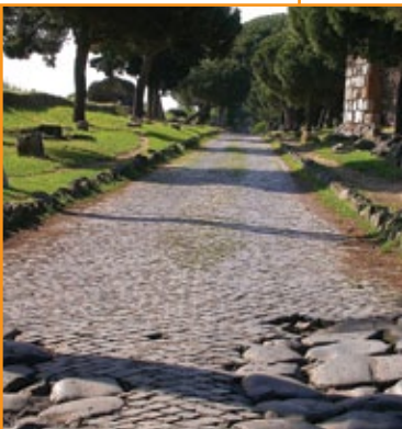
Via Appia, 312 a.C.