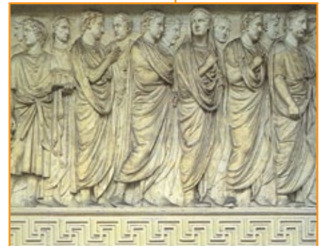
Ara Pacis, particolare del bassorilievo.