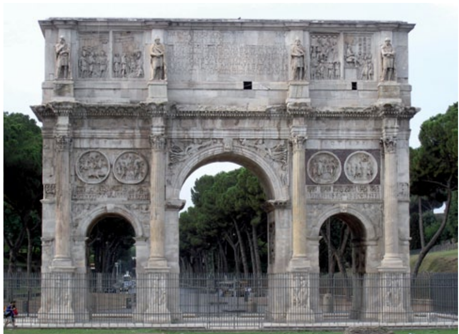
Arco di Costantino, 315 d.C., marmo, alt. 25 m, Roma.