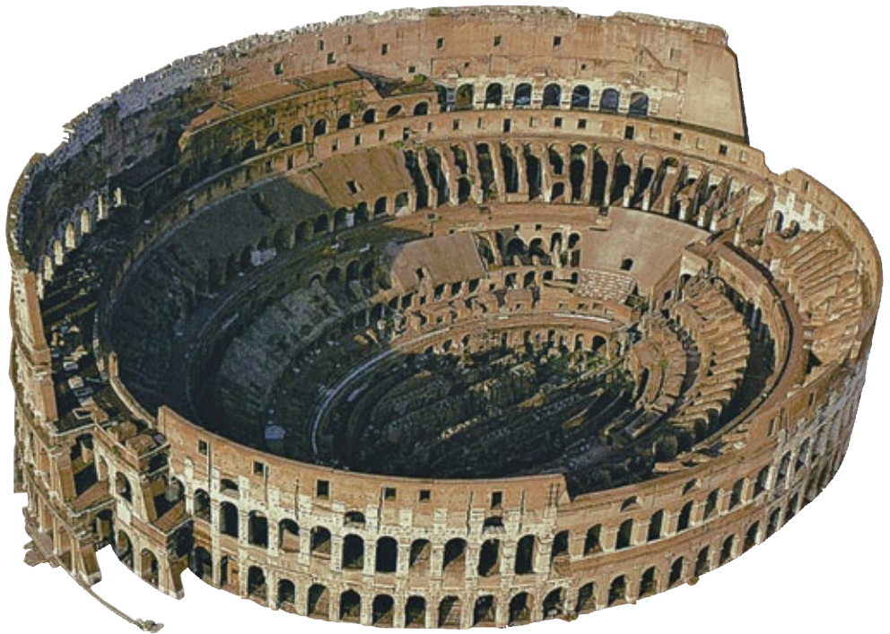
Anfiteatro Flavio (Colosseo), 70-79 d.C. Roma.