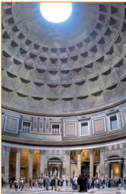
Pantheon , 126 d.C. circa, Roma.