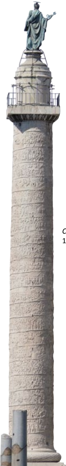
Colonna Traiana, 113 d.C. Roma.

Le grandi opere pubbliche testimoniano l'efficienza costruttiva dei Romani. La monumentalità degli edifici civili e religiosi sono un segno del potere imperiale.