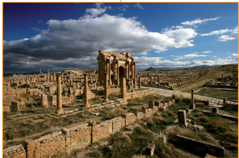
Timgad , colonia romana in Algeria.