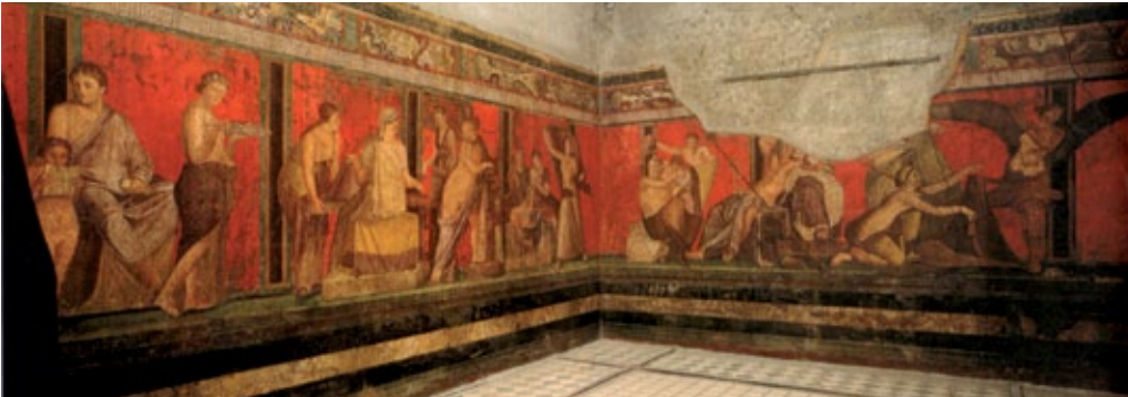
Fregio ad affresco del triclinio della Villa dei Misteri a Pompei.

I soggetti si ispirano a paesaggi mitologici e di fantasia. Si riconosce l'influenza dei modelli greci, trasmessa dai centri della Magna Grecia, arricchiti da una spiccata tendenza al realismo. Nel tardo impero, vengono introdotti caratteri mistici e valori simbolici