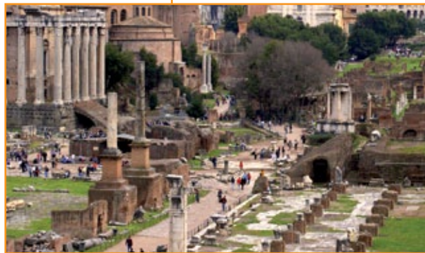
Particolare del foro romano, Roma.